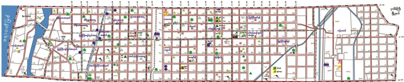
မဟာအောင်မြေမြို့နယ်